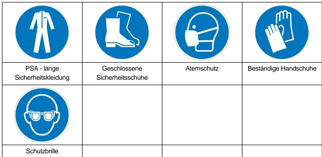
Tabelle 2: Empfohlene persönliche Schutzausrüstung